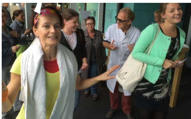
‘Leer lijnen’ met Plankiers Toneel

“Goede workshops waarbij met name die over Kunstkracht 10 zorgden voor veel duidelijkheid. Inspirerend, zin om er mee aan de slag te gaan.”