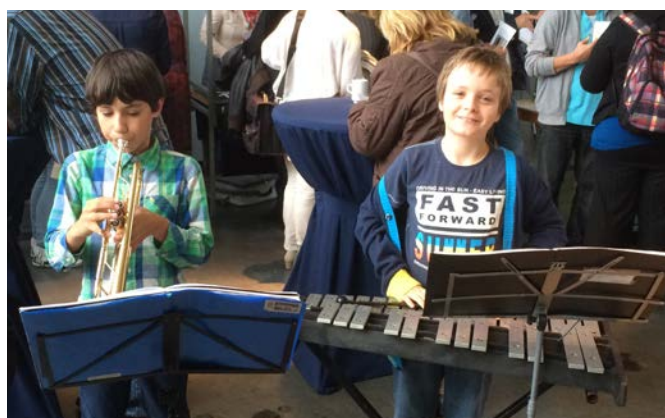
Leerlingen van muziekvereniging De Phoenix lieten van zich horen