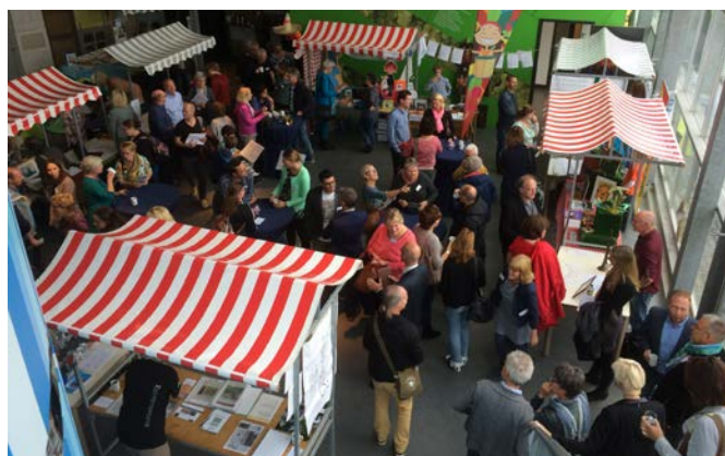
Ontmoeten en netwerken tijdens de culturele markt